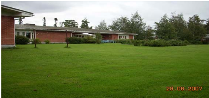
Åldringshemmets uteplats med bärbuskar och ett litet jordgubbsland