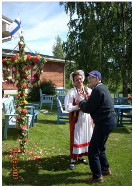
.....men visst kan man njuta av sommarens grönska med en dans till spelmansmusik och midsommarstång