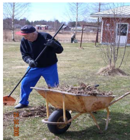
... eller kanske med att förbereda gräsmattan att grönska