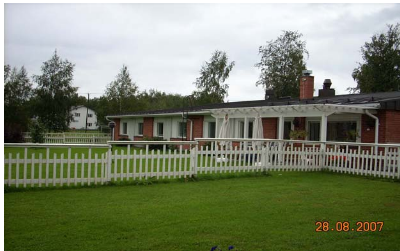
Roslundens demenshem med eget uteområde och en terrass som är flitig i användning under sommарhalvåret