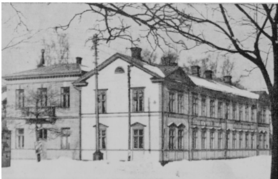
Gamla Fylgia, Handelsplanaden 32 1898-1969

Föreningen Fylgia har sedan 1898 upprätthållit ett hem med service, vård och omsorg för svenskspråkiga åldringar i Vasa. Verksamheten i "Fylgias hem för de gamla" inleddes 1898 i ett trähus i 1 1/2-plan i hörnet av Handelsplanaden och Korsholmsplanaden i centrala Vasa. Målgruppen var "Vasa stads ålderstigna och värnlösa fruntimmer" ("skyddslingar"). Trots det centrala läget "mitt i stan" omgavs huset av grönskande alléer längs de båda esplanaderna. På innergården fanns potatisland och annan nyttododling men även prydnadsväxter; perenner, hägg och syren. De boende deltog efter förmåga i alla förekommande sysslor på hemmet, också i trädgårdsskötseln.