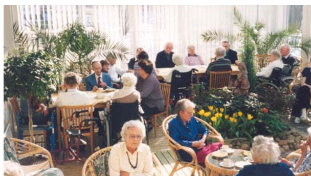
Valborgsfest i den grönskande vinterträdgården "i plast"