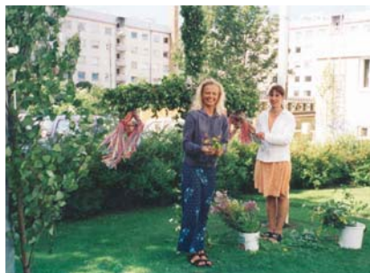
Midsommarafton, majstången kläds....

- En trädgård behöver tas om hand, vårdas och förnyas, vilket kräver personer med tid och intresse. På ett privat litet servicehem, som Fylgia, är de personella resurserna, idéerna och kunskan begränsade. Fylgia kan inte hålla sig med en professionell trädgårdsskötare, varför all skötsel skall ske på sidan om det övriga av personal, som anställts för andra uppgifter.