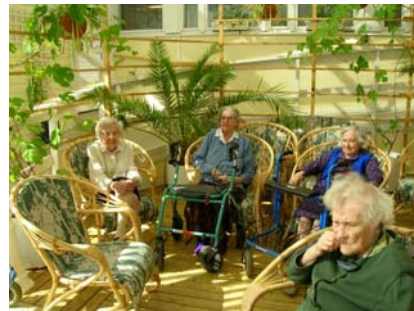
En skön stund i vinterträdgården