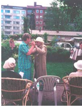
...och dansen går