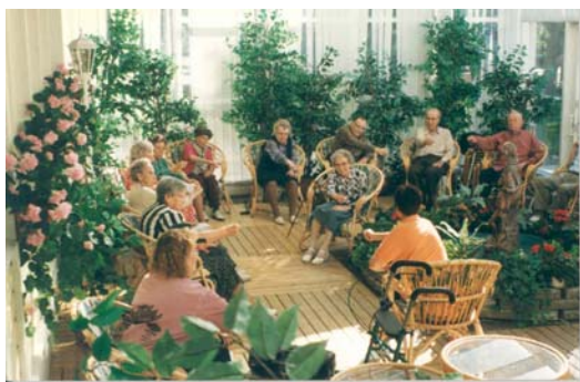
Sittgymnastik i vinterträdgården

Eftersom vinterträdgården byggts "över" perennrabatten fanns behov av upprustning/nydaning av uteträdgården. Den skyddande vinkeln, som uppstått mellan huskroppen och vinterträdgården, blev en solplats för hemmets pensionärer. Längs väggen planterades ölandstok, norsk spirea och året runt gröna buskar. Sol-/sittplatsen försågs med gångplattor i betong, bekväma trädgårdsmöbler med skyddande parasoll och en rabatt med gula och röda rosor. Den framförliggande gräsmattan ingärdades med en häck av brudspirea och ett staket i trä, som samtidigt skiljde "det gröna" från bilparkeringen.