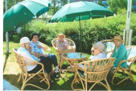
Skönt att bara vila under parasollen