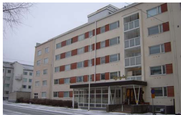
Nya Fylgia, Skolhusgatan 34 1969- (efter tillbyggnad)

Huset i trä utbyttes år 1969 till ett nybyggt 5-vånings hus i betong försett med källarvåning och vind längs Skolhusgatan, en annan av Vasas livligt trafikerade gator. Huset hade uppförts och utrustats för att möta tidens krav på god åldringsvård. Alla boende fick egna rum. Nu gavs också äldre herremän tillträde till Fylgia.